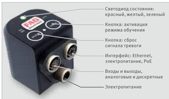
Интерфейс и органы управления FAG SmartCheck