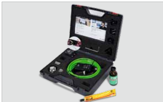
FAG SmartCheck Service-Kit